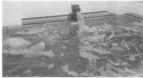
〈ご自慢の薬湯風呂〉