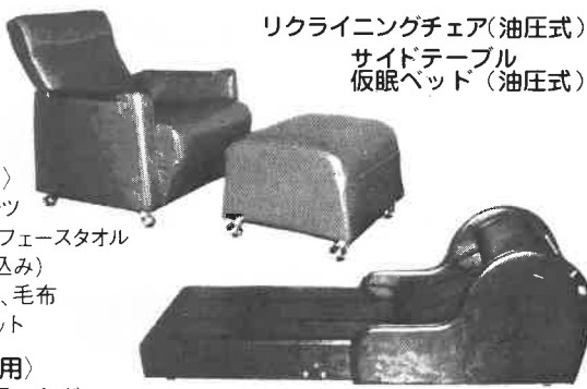
リクライニングチェア(油圧式) サイドテーブル 仮眠ベッド(油圧式)

〈サウナ用〉 ガウン、パンツ バスタオル、フェースタオル (名入れ織込み) タオルケット、毛布 サウナ室マット