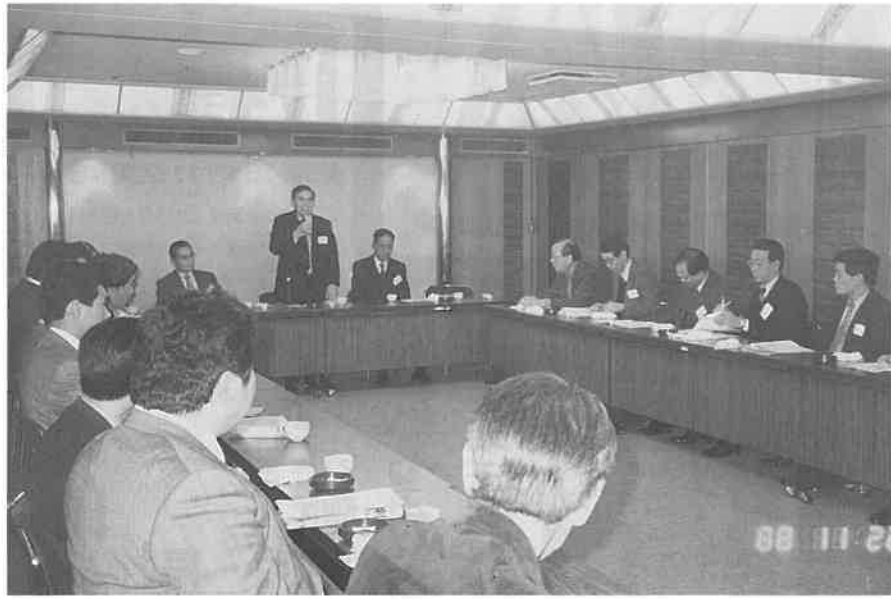
法人化へ向けて共に頑張ろう…と挨拶する中野会長