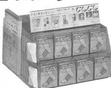
100個入ショーケースPOP 試着サンプル、チラシ入れ付 420×260×210mm (ケース別売です)