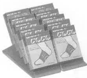
10個入ヒナ段ケース 90×130×280mm