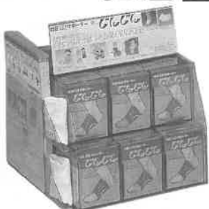
60個入ショーケース、POP 試着サンプル、チラシ入れ付 340×305×290mm (ケース別売です)