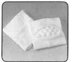
●トレペ7.の特殊成型品が「土踏まず」を刺激!!

製造発売元 東レ株式会社 ペフ事業部 東京都中央区日本橋室町2丁目2番地1号 〒103 TEL.03(245)5552(直通) 大阪府北区中之島3丁目3番地3号 〒530 TEL.06(445)3733(直通)